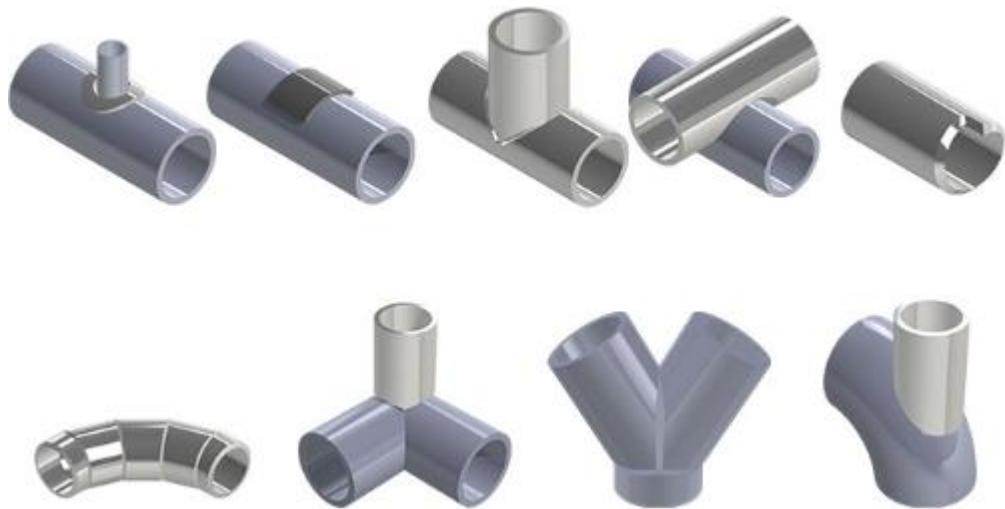
Hình 1.3: Ống được cắt và ghép theo hướng tùy chỉnh

- Cắt tùy chỉnh (Custom Angle Saddle Cut): Khi góc kết nối cần khác với góc 45 hoặc 90 độ, kỹ thuật cắt tùy chỉnh sẽ được áp dụng để đảm bảo mối nối phù hợp với yêu cầu cụ thể của dự án.