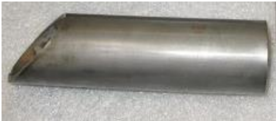
Hình 1.5: Ống cắt ngàm góc vát

- Miter Saddle Cut (Cắt ngàm góc vát): Đây là loại cắt mà phần đầu của ống nhánh được cắt theo đường thẳng, tạo ra góc vát giúp kết nối ống nhánh với ống chính ở góc xác định. Thường được dùng trong các kết nối ở góc hẹp.