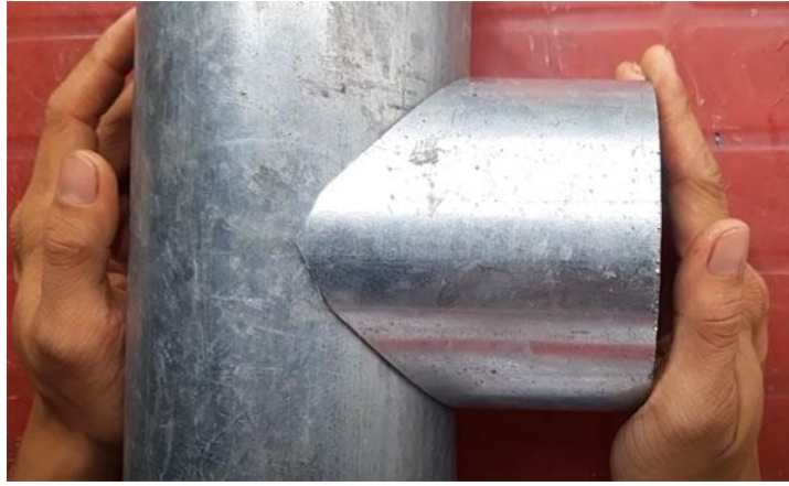
Hình 1.2: Ống được cắt và ghép theo góc 90° [1]

- Cắt tùy chỉnh (Custom Angle Saddle Cut): Khi góc kết nối cần khác với góc 45 hoặc 90 độ, kỹ thuật cắt tùy chỉnh sẽ được áp dụng để đảm bảo mối nối phù hợp với yêu cầu cụ thể của dự án.