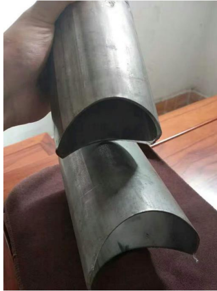
Hình 1.4: Ống cắt kiểu miệng cá

- Miter Saddle Cut (Cắt ngàm góc vát): Đây là loại cắt mà phần đầu của ống nhánh được cắt theo đường thẳng, tạo ra góc vát giúp kết nối ống nhánh với ống chính ở góc xác định. Thường được dùng trong các kết nối ở góc hẹp.